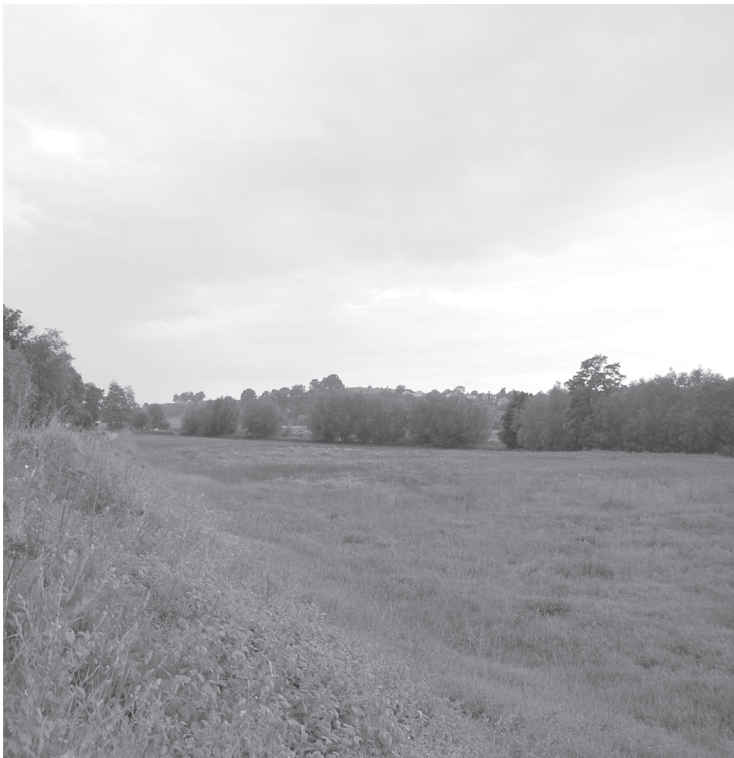
Północno-zachodnia część wsi Tyńca nazywa się Zwierzyniec